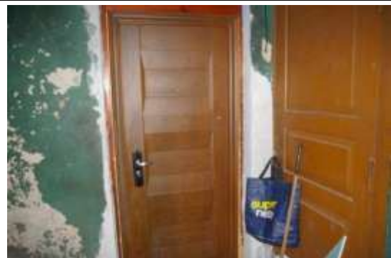
Būve ar kadastra apzīmējumu 6492 006 4257 001, dzīvoklis Nr.6