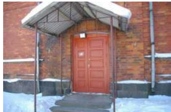
Būve ar kadastra apzīmējumu 6492 006 4257 001