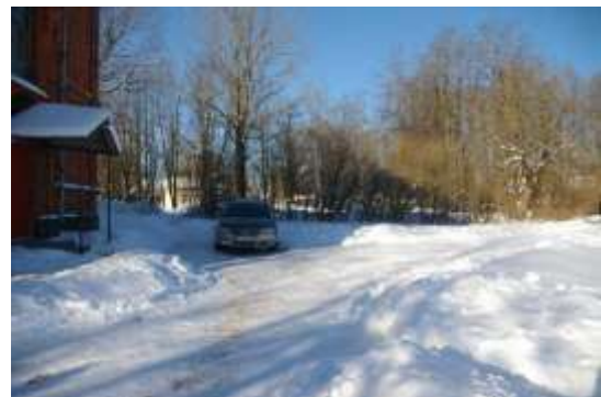
Zemes gabals ar kadastra apzīmējumu 6492 006 0757