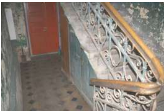
Būve ar kadastra apzīmējumu 6492 006 4257 001, koplietošanas telpa