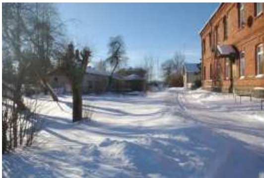
Zemes gabals ar kadastra apzīmējumu 6492 006 0757